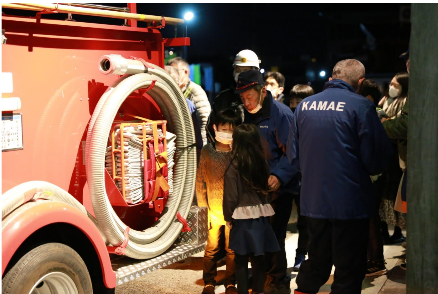
子ども達も間近に消防車を見学して楽しむことができました。