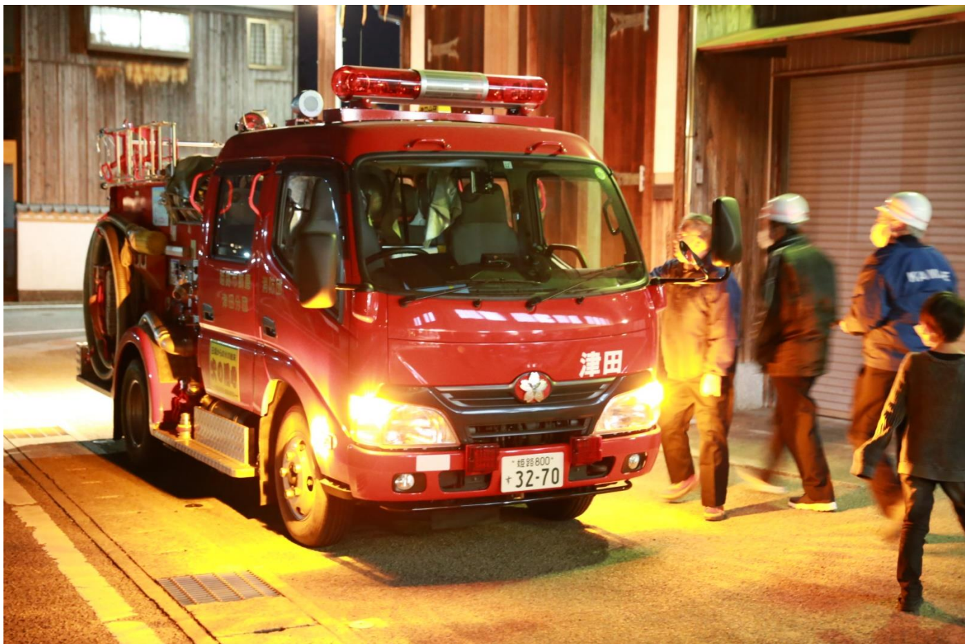
津田分団の消防車が年末警戒活動途中で公民館に立ち寄ってくれました。