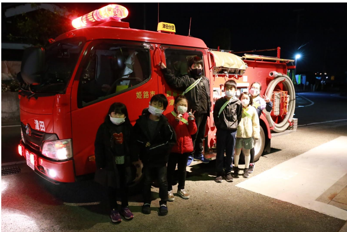
寒い中お疲れさまでした。