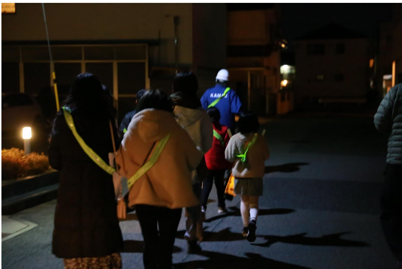
毎日津田小学校まで登校して鍛えている子どもたちの健脚に驚きながら大人たちも頑張りました。