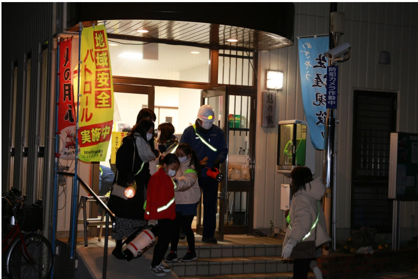
参加してくれた子どもたちです。