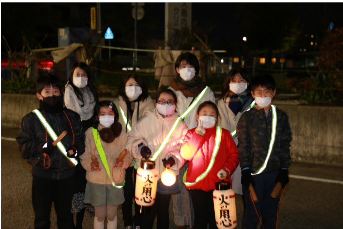
付き添いのお母さん方も寒い中頑張ってくれました。