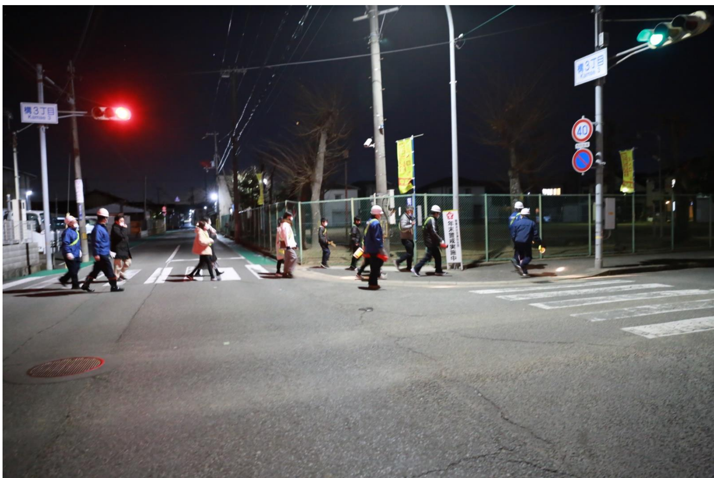
夜の構公園です。すれ違う車の運転手さんにも呼びかけが届いていました。