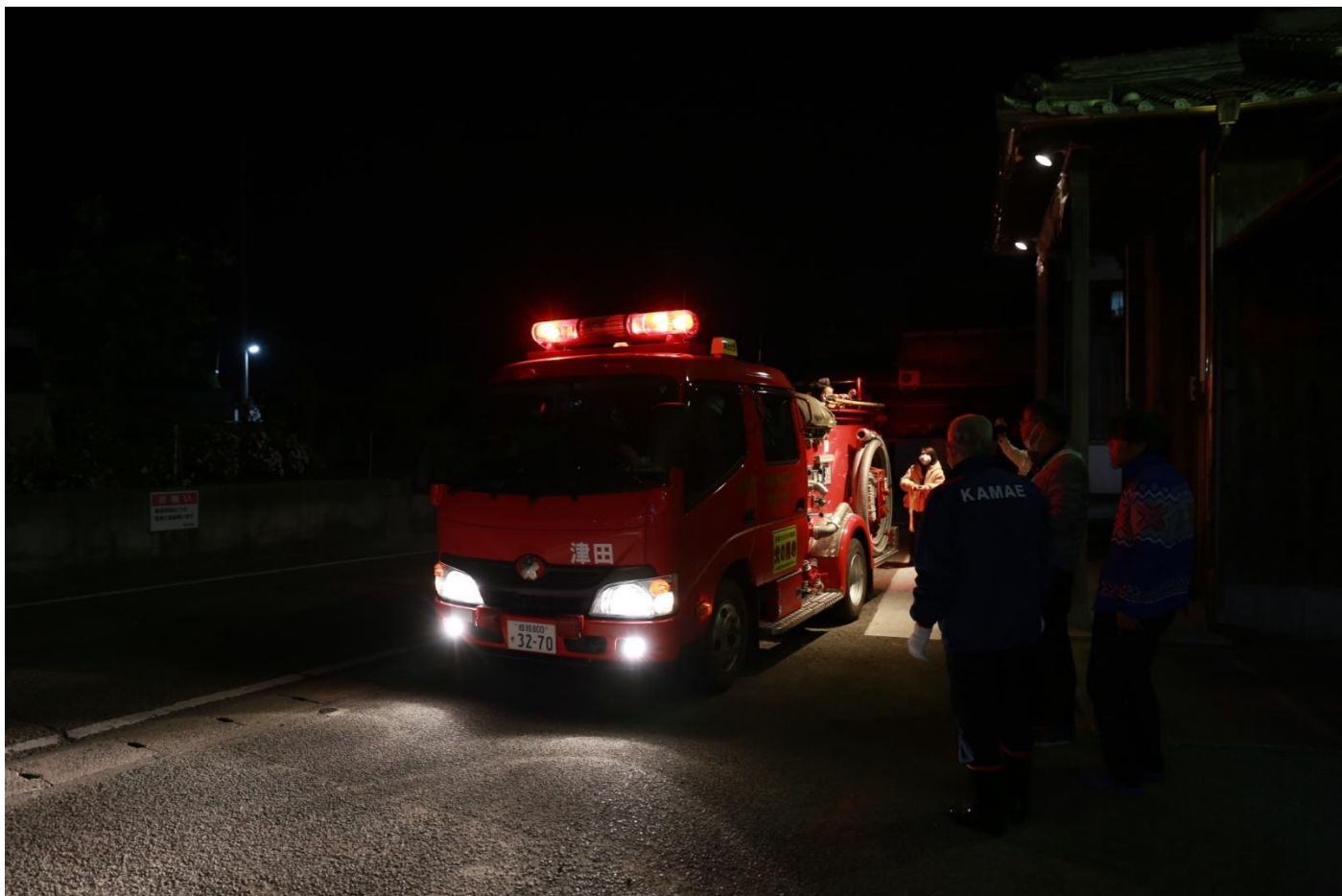
パトランプや警鐘を作動させて迫力満点。記念撮影もばっちりできました。