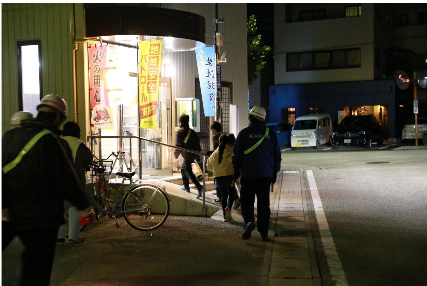
公民館まで帰ってきて、一休みしました。